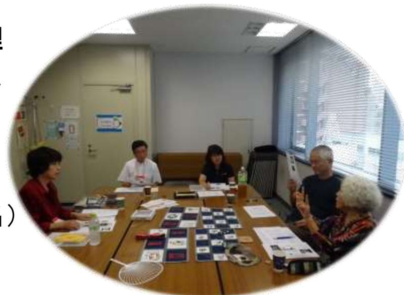
商品開発の検討の様子です

最大のテーマである課題の整理は、様々な条件を完全にクリアするまでには至りませんでした。作業環境の改善（整理整頓）を中心に、生地など在庫を活かした幾つかの製品開発を提案させて頂くことが出来ました。