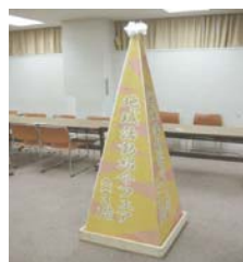
地域活動紹介フェア