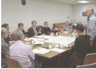
世田谷区地域ビュー体験ワークショップ