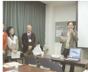
ひとまち塾人材養成講座に参加、成果発表会