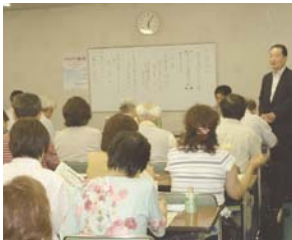
高齢者医療についての講演会