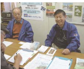
地域活動紹介フェアに出展参加