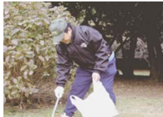
駒沢公園清掃のボランティア