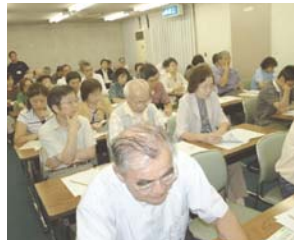
会場いっぱいの聴講者