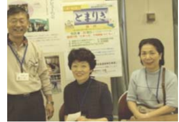
玉川で開催された生涯現役フェアに出展