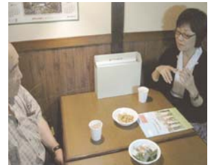
地域の絆「とまりぎ」にて