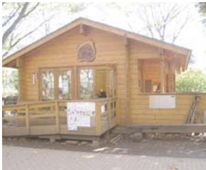
都立芦花公園内のログハウスでボランティア