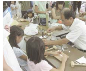
豊島区のエコフェアに出展