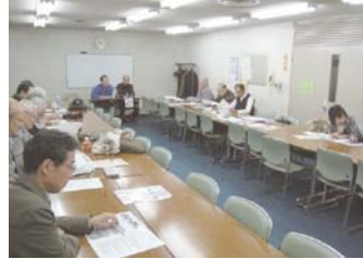
月例会には 20 名から 25 名が参加されます。