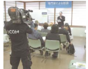
烏山で開催された地域活動紹介フェアに協力