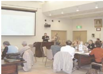
生涯現役フェア出展ワークショップ