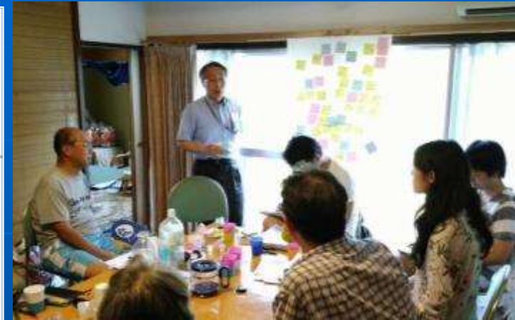
(実際の成果物の一部)

目的.50.60代会員獲得と地域のニーズに対応するための活動の見直し 支援メニュー: プロボノ1DAYチャレンジ 課題整理ワークショップ 中心メンバーが高齢化している会の若返りとともに、買い物、外出のための移動、不在地主など、新たな地域のニーズにどこまで取り組むのか、団体と地域の課題を整理。 広報の方法の改善案や実施するイベント内容等をチームから提案された。