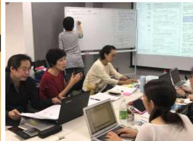
(ママボノチームで応援)