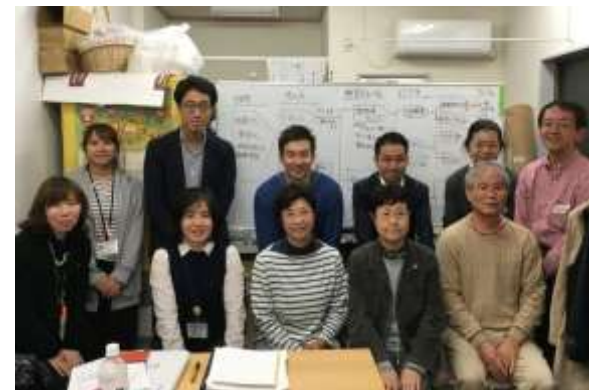
(プロボノチームとの集合写真)

目的: 運営資金面で課題を抱える現状から、持続可能な運営を目指していくために収益を伴うような事業の可能性を探る