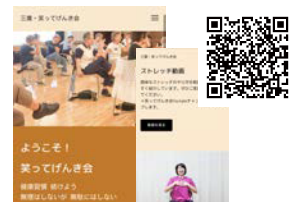
完成したウェブサイト

会の情報を、オンラインでいつでも誰でも見られるように、プロボノチームがウェブサイトを作成。メンバーへのヒアリングも行き、スマホでも見やすく更新しやすいサイトが完成しました。